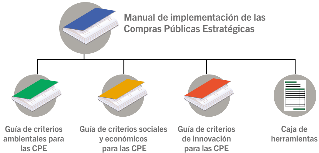
Figura 1. Instrumentos para las CPE en Costa Rica.

Los lineamientos incluidos en esta guía, orienta las acciones específicas para el cumplimiento de los objetivos de la Compra Pública Estratégica (CPE) establecidos en los artículos 20 y 21 de la LGCP, 46 de su reglamento y demás concordantes, así como sus reformas, que refieren la incorporación de criterios sociales y económicos en los pliegos de condiciones. No pretende definir todos los pasos del procedimiento de contratación pública ni entrar en detalle sobre procesos administrativos que son responsabilidad de la Administración activa, ni incluye aspectos relacionados a criterios ambientales ni de innovación, dado que para tales efectos se emiten en los documentos correspondientes, asociados al MICPE, como se muestra en la Figura 1.