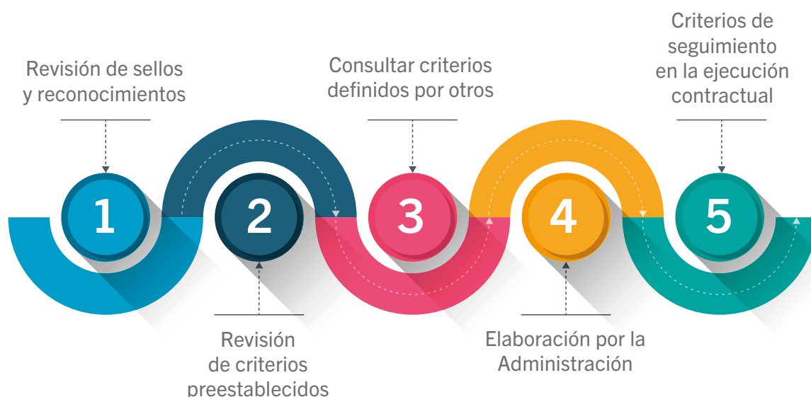
Figura 2. Secuencia de revisión de referencias para la definición de criterios sociales y económicos

Para la definición de los criterios de sociales y económicos se deben seguir los siguientes pasos en secuencia (Figura 2). Cuando obtenga un resultado, no será necesario continuar con los pasos subsiguientes.